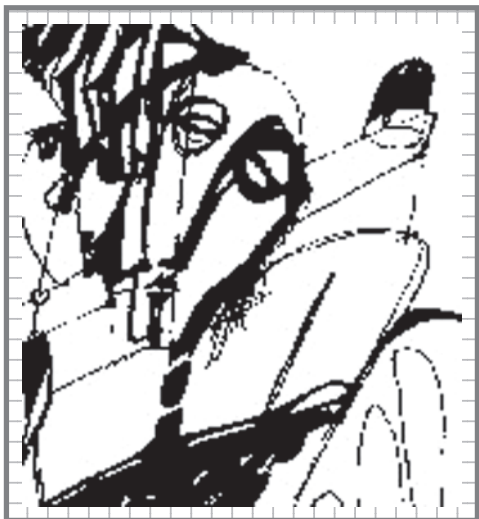
Рисунок А. Немировского.

Недавно в Новосибирском государственном художественном музее прошла удивительная выставка картин, заполнившая 4 больших зала — живопись и графика безвременно ушедшего из жизни в 23 года вполне сложившегося и безусловно одарённого художника и поэта Александра Немировского,