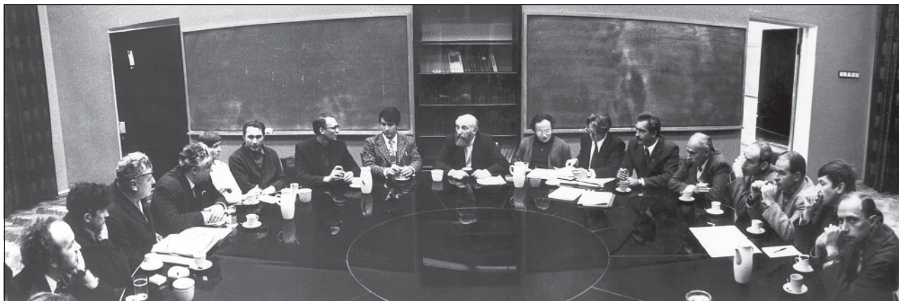
Круглый стол уже есть, но находится там, где сейчас приемная директора.