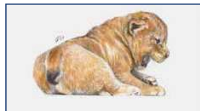
Детеныш гомотерия. Рисунок Исако Альберти, Флоренция (Isacco Alberti), подаренный авторам публикации.