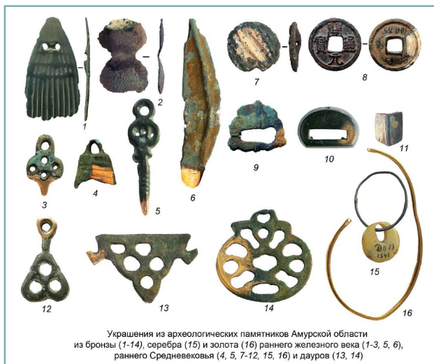
Украшения из археологических памятников Амурской области из бронзы (1-14), серебра (15) и золота (16) раннего железного века (1-3, 5, 6), раннего Средневековья (4, 5, 7-12, 15, 16) и дауров (13, 14)

«Некоторые вещи явно неместного происхождения. Например, пять бляшек пояса так называемого уйгурского типа. Этот пояс очень ценили и, по всей видимости, берегли, потому что на нем заметны следы ремонта. В некоторых случаях переплавка предметов шла настолько активно, особенно