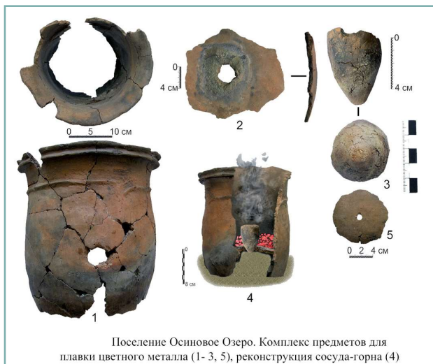
Поселение Осиновое Озеро. Комплекс предметов для плавки цветного металла (1-3, 5), реконструкция сосуда-горна (4)