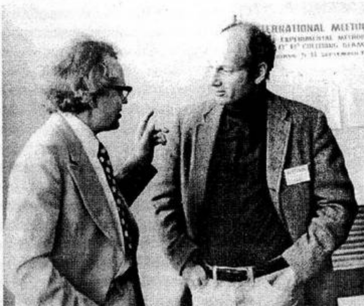
В. Сидоров, Дж.В. Кронин. 1977 г.