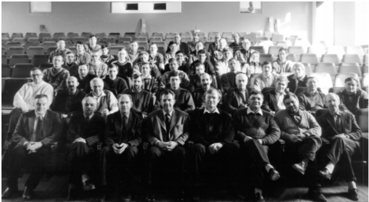
Преподаватели НГУ — сотрудники нашего института — в неполном составе.

Сегодня в институте работают 310 выпускников НГУ, среди которых три члена-корреспондента РАН, 22 доктора наук, около 100 кандидатов наук, два заместителя директора, девять заведующих лабораториями. Плодотворное, взаимно обогащающее сотрудничество ИЯФ и НГУ крепнет с каждым годом, и нет сомнения в том, что наука XXI в нашем институте будет развиваться в значительной степени и выпускниками НГУ.