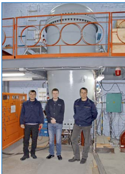
Начало на стр. 7.

рынков сбыта своей продукции. Экономика Индии динамично развивается, дешевая рабочая сила обеспечивают высокую конкурентоспособность и низкую цену выпускаемой продукции. Многочисленное население позволяет иметь гарантированный внутренний рынок.