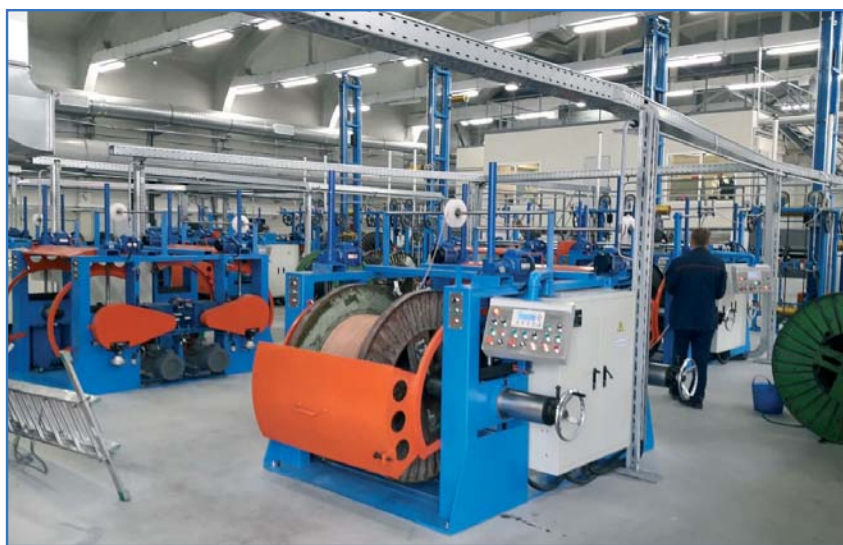
Ускорители ЭЛВ на кабельном заводе в г. Кольчугино Владимирской области.

На установке проводятся различные эксперименты в области радиационных и радиационно-термических процессов. Отрабатываются технологии получения наноразмерных порошков металлов, а также на-